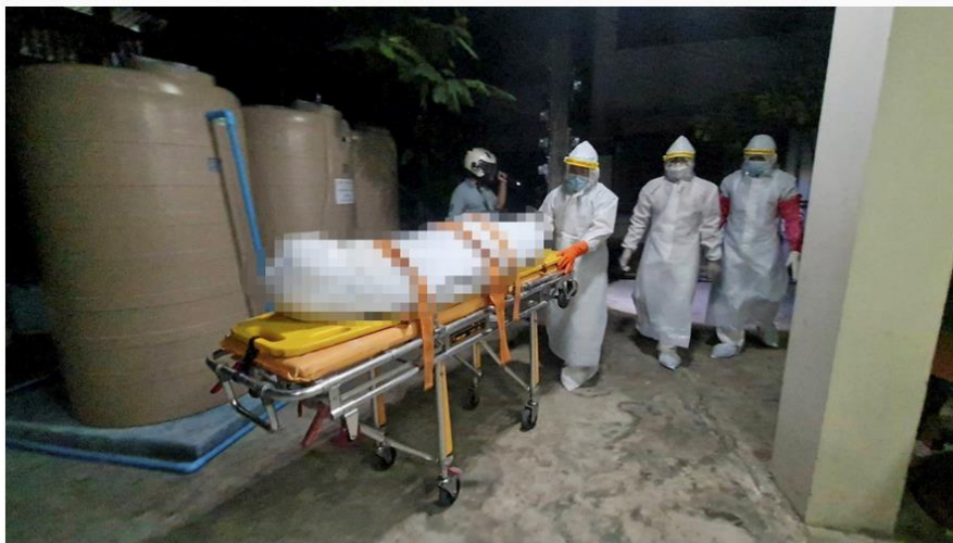
ตายคาบ้าน

เว็บไซต์ : https://www.thairath.co.th/news/local/bangkok/2334497